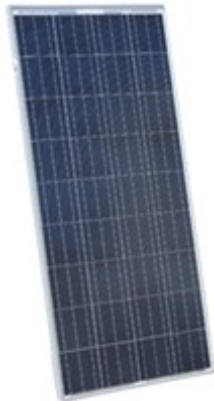
Solarmodul 410 Wp